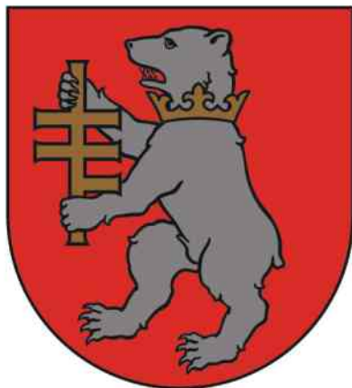
II. 2b. HERB POWIATU RADZYŃSKIEGO (w. w metalu) koncepcja heraldyczna: prof. dr hab. Krzysztof Skupieński proj. graf.: art. grafik Dariusz Dessauer 2004