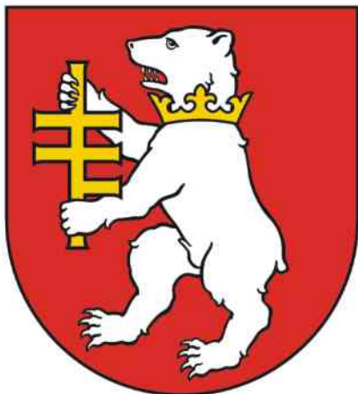
II. 2a. HERB POWIATU RADZYŃSKIEGO koncepcja heraldyczna: prof. dr hab. Krzysztof Skupieński proj. graf.: art. grafik Dariusz Dessauer 2004