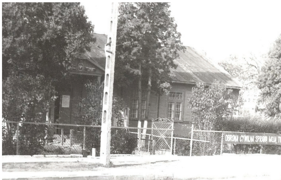
Źródło: Budynek Urzędu Gminy w Wiśniewie z 1986 r. ze zbiorów prywatnych autora.