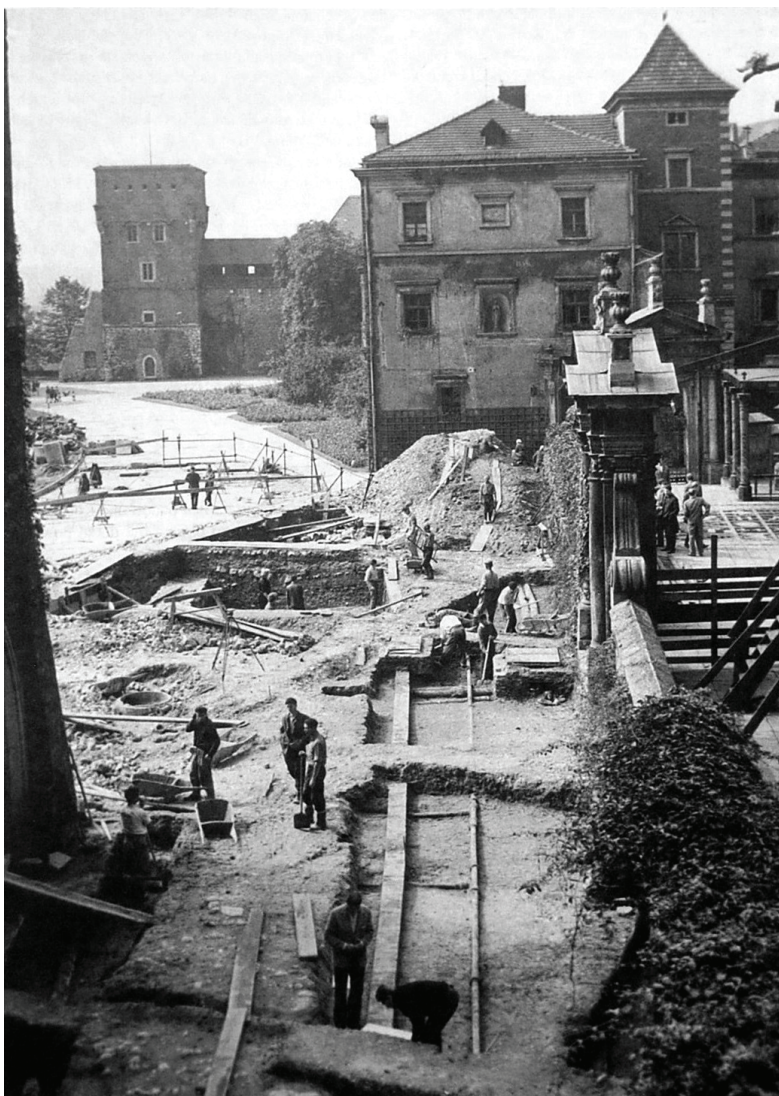
Fot. 1. Kraków – Wawel. Wykopalka prowadzone w 1969 roku w centralnej części wzgórza (fot. A.Wierzba).

strukcji drewnianych, zalegających w warstwach przed północną elewacją pałacu królewskiego 43 . Dalsze ślady po naziemnych chatkach?, uchwycono na południowy zachód od reliktyw kościoła św. Michała 44 .