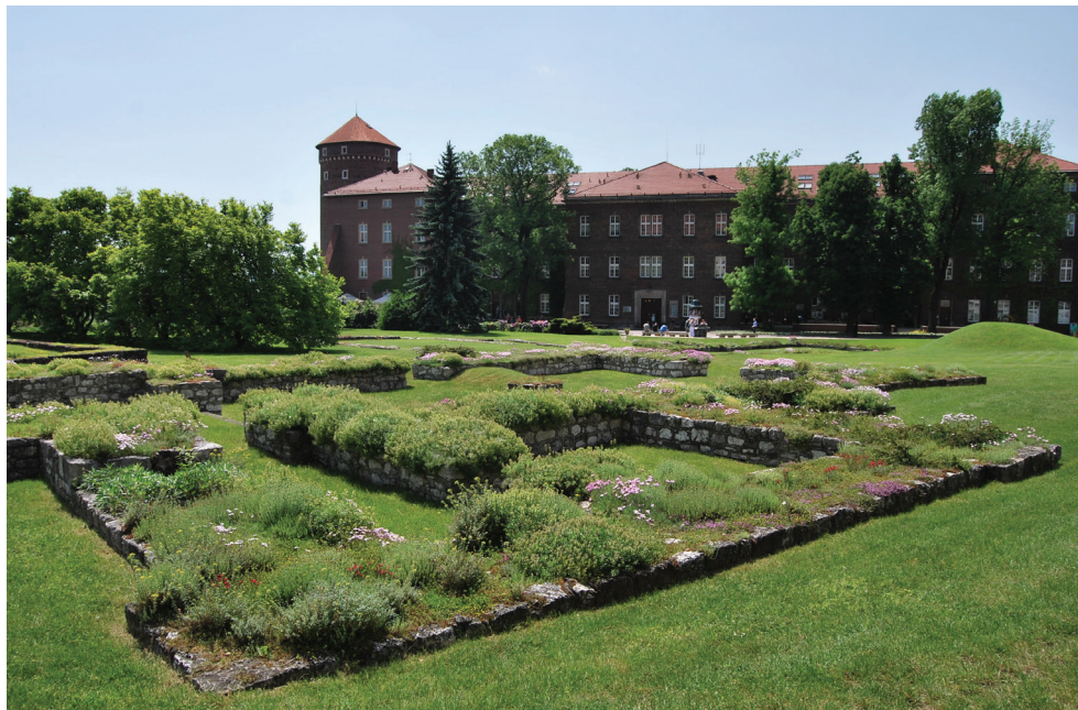
Fot. 2. Kraków-Wawel. Relikty kościoła św. Michała na wzgórzu wawelskim.

Zrelacjonowana wyżej lista kamiennych obiektów Wawelu doby państwowej wczesnego średniowiecza, choć znaczna, może zostać jeszcze w przyszłości uzupełniona. Trwające nieprzerwanie od ponad 60 lat badania architektoniczno-arche-