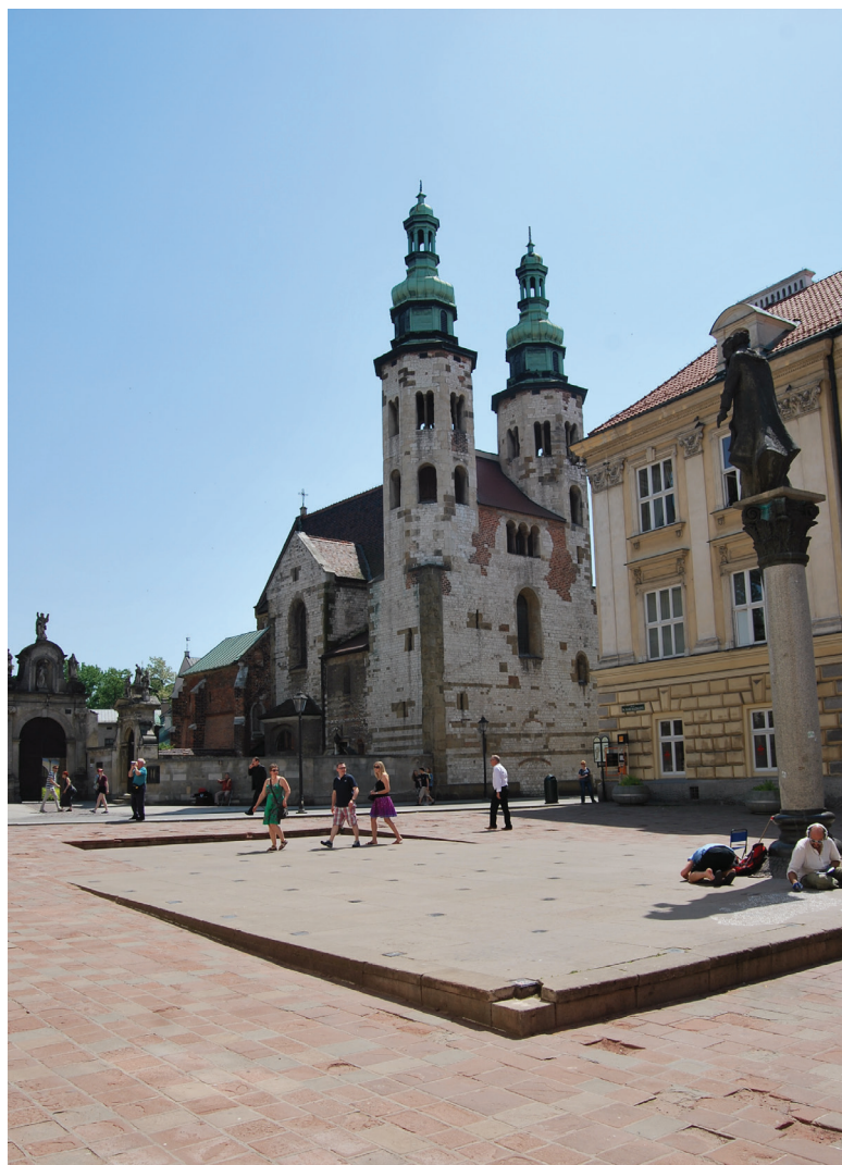
Fot. 3. Kraków-Okół. Plac św. Magdaleny i kościół św. Andrzeja.

nie obiekt usytuowany był na placu św. Marii Magdaleny, około 20 m na północny zachód od kościoła św. Andrzeja. Jego fundamenty zalegały nad warstwami osadniczymi pochodzącymi od poł. IX do XIII w. Pierwsze pisemne wzmianki o nim pochodzą z akt świętopietrza z 1. poł. XIV w., ale za wcześniejszym powstaniem przemawiają romańskie pozostałości w postaci ciosów wapiennych z obwodowych murów nawy, prezbiterium, części ołtarza oraz romańskie płytki posadzkowe po-