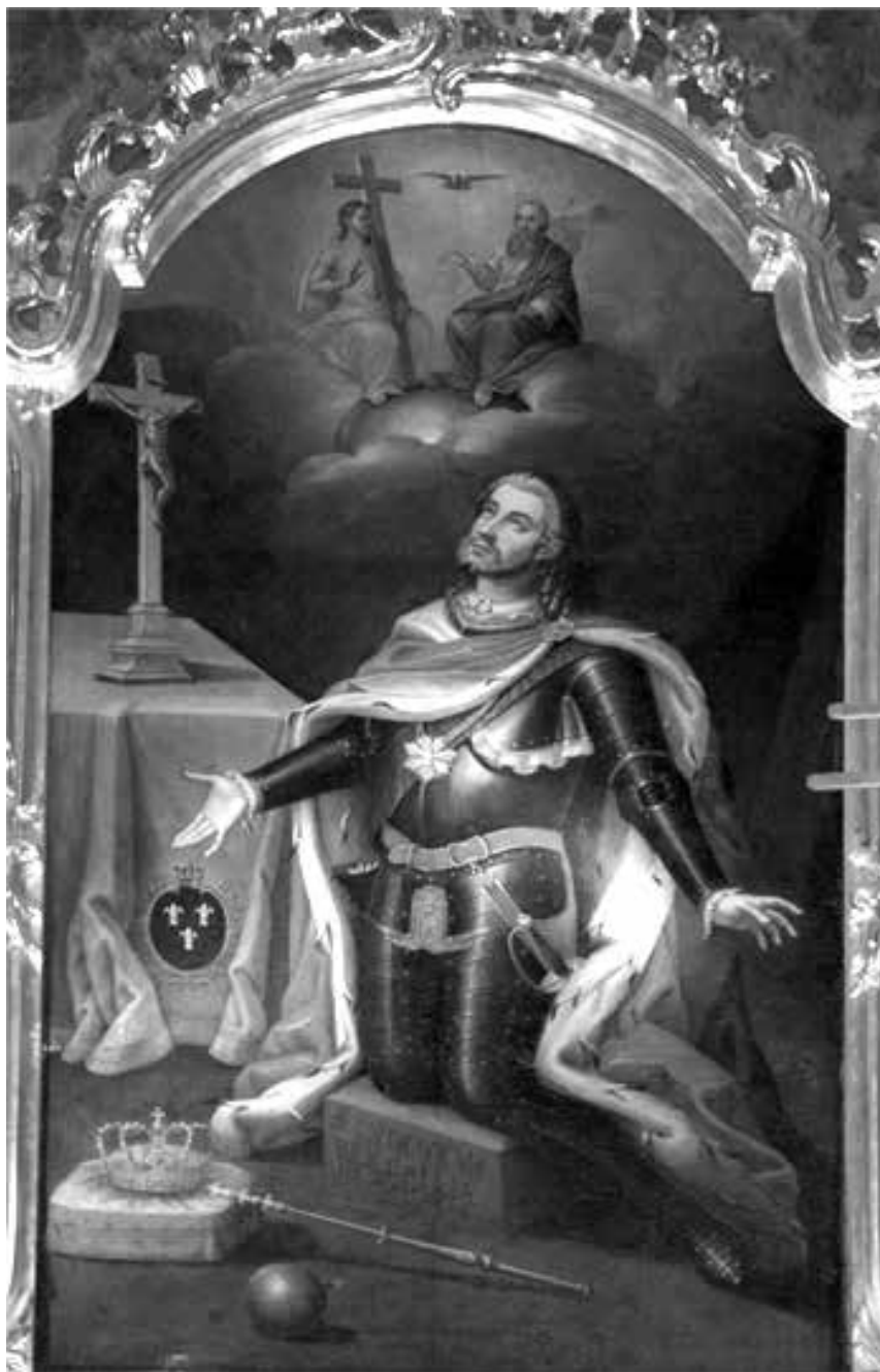
Il. 7. Włodawa, kościół św. Ludwika Króla, obraz Świętego Ludwika w ołtarzu głównym, 1774, wg [online] http://www.wlodawa.paulini.pl/122,Sw--Ludwik---Patron-Parafii [13.04.2012].