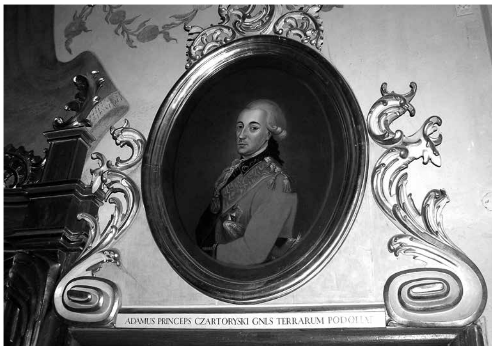
Il. 11. Włodawa, wschodnia ściana prezbiterium kościoła św. Ludwika Króla, portret Adama Kazimierza Czartoryskiego, 1780–1783, fot. M. Ludera.