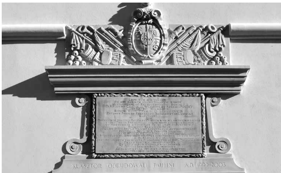
Il. 2. Włodawa, południowe skrzydło klasztoru Paulinów, tablica fundacyjna i kartusz herbowy ponad rekonstruowanym portalem (pierwotnie na fasadzie niezachowanej kaplicy przyklasztornej?), 1717, fot. M. Ludera.