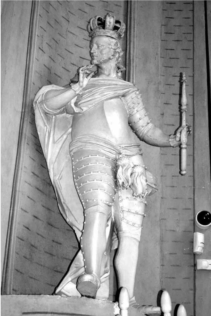
Il. 14. Włodawa, kościół św. Ludwika Króla, rzeźba Cesarza Konstantyna Wielkiego, 1783–1785 (zapewne po 1784), M. Polejowski, fot. M. Ludera.