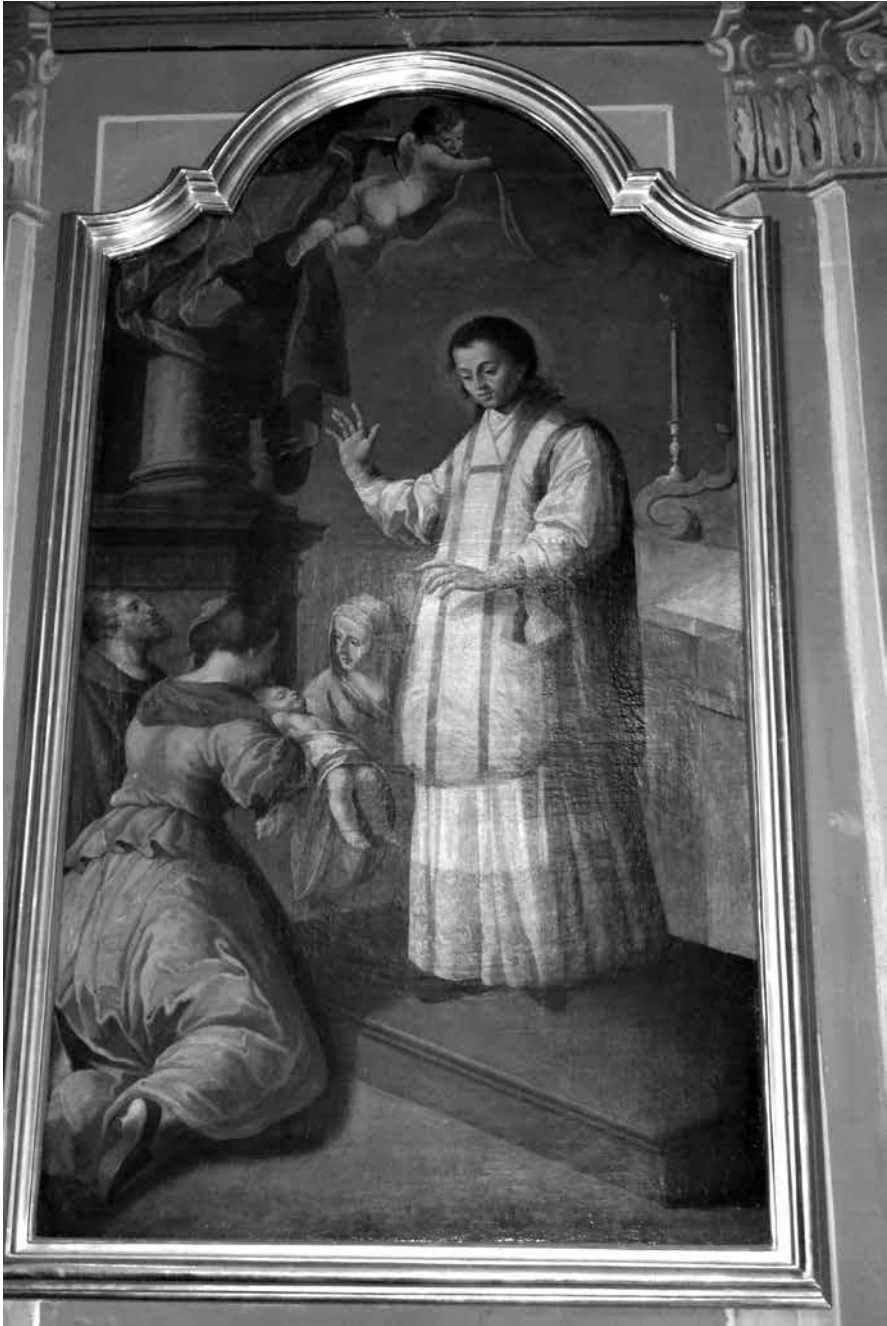
Il. 16. Włodawa, kościół św. Ludwika Króla, obraz Świętego Walentego, przed ost. ćw. XVIII w. (w ołtarzu umieszczony po 1778 r., zapewne ok. 1785), krąg Sz. Czechowicza, fot. M. Ludera.