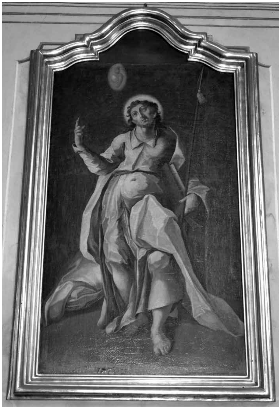
Il. 20. Żółkiewka, kościół św. Wawrzyńca, obraz Świętego Tomasza Apostoła, ok. 1776, Gabriel Sławiński, fot. M. Ludera.