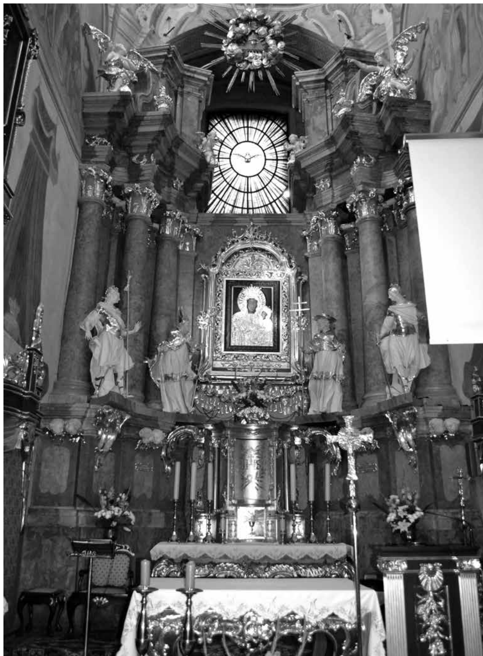
Il. 6. Włodawa, prezbiterium kościoła św. Ludwika Króla, ołtarz główny, 1752/1753-ok. 1774–po 1784/1786, fot. M. Ludera.