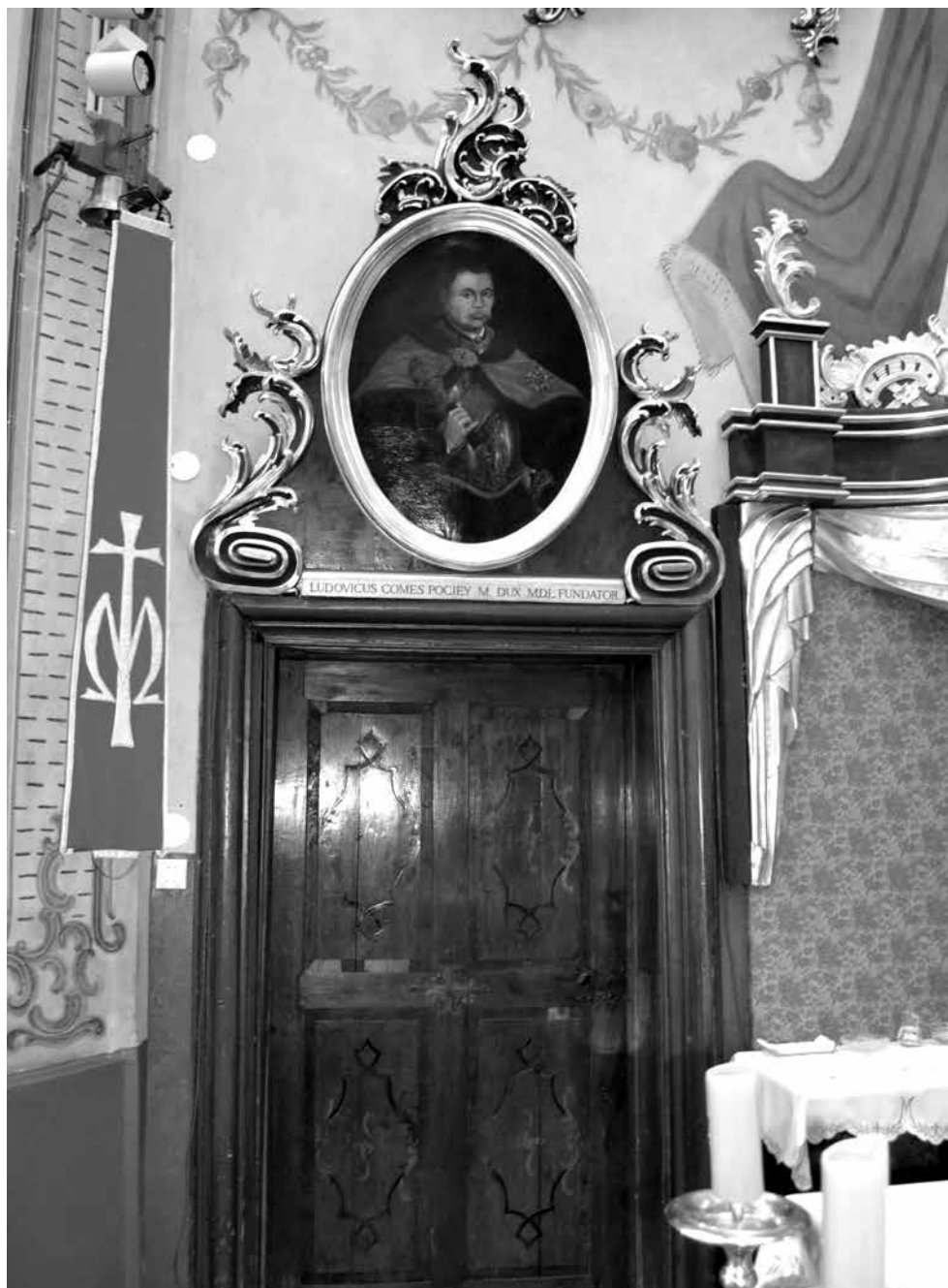
Il. 10. Włodawa, zachodnia ściana prezbiterium kościoła św. Ludwika Króla, portret Ludwika Konstantego Pociąga, XVIII w. (może tożsamy z wzmiankowanym od 1728 r.; umieszczony w supraporcie w latach 1780–1783), fot. M. Ludera.