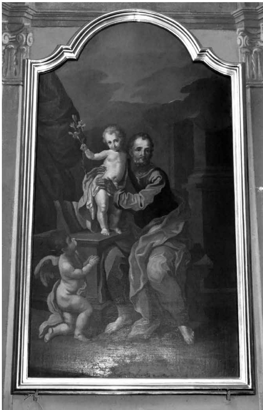
Il. 15. Włodawa, kościół św. Ludwika Króla, obraz Świętego Józefa, przed ost. ćw. XVIII w. (w ołtarzu umieszczony po 1778 r., zapewne ok. 1785), krąg Sz. Czechowicza, fot. M. Ludera.