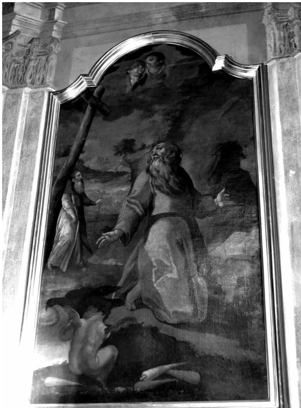
Il. 17. Włodawa, kościół św. Ludwika Króla, obraz Świętego Pawła Pustelnika, ost. ćw. XVIII w. (w ołtarzu umieszczony po 1778 r., zapewne ok. 1785), fot. M. Ludera.