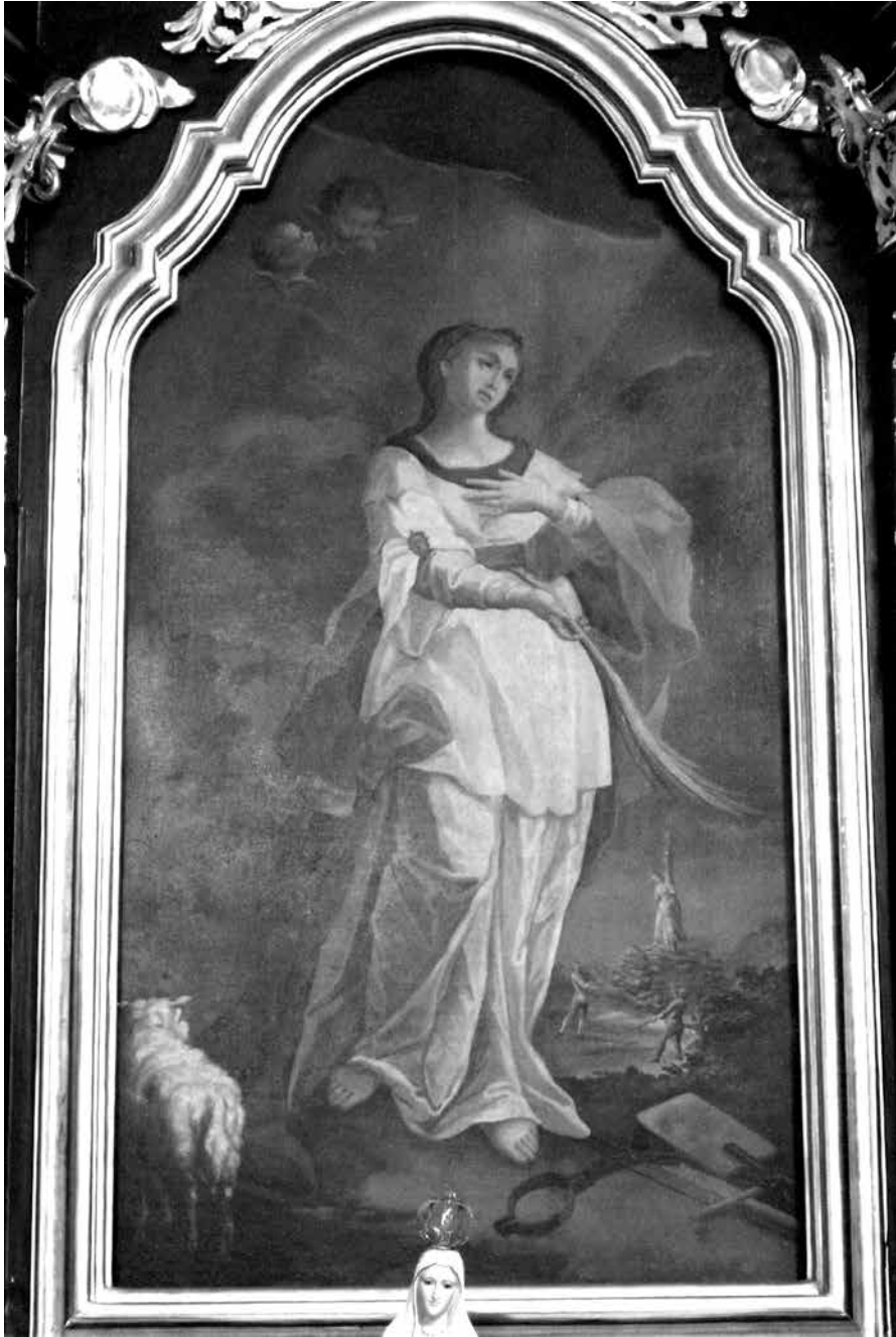
Il. 19. Radzięcín, kościół św. Kazimierza, obraz Świętej Agnieszki, ost. ćw. XVIII w. (zapewne ok. 1790).