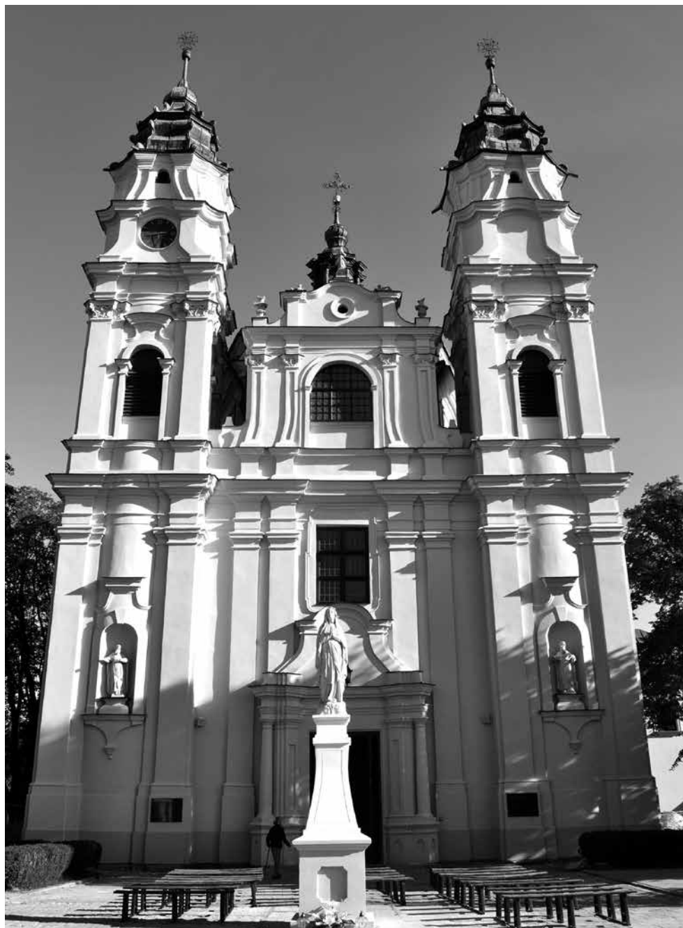
Il. 3. Włodawa, kościół św. Ludwika Króla (1719/1722-1739/1741-1752-1785), proj. P.A. Fontana