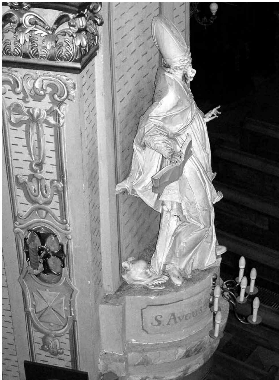
Il. 13. Włodawa, kościół św. Ludwika Króla, rzeźba Świętego Augustyna, 1783–1785, M. Polejowski, fot. M. Ludera.