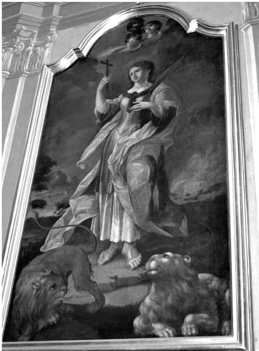
Il. 18. Włodawa, kościół św. Ludwika Króla, obraz Świętej Tekli, ost. ćw. XVIII w. (w ołtarzu umieszczony po 1778 r., zapewne ok. 1785), fot. M. Ludera.