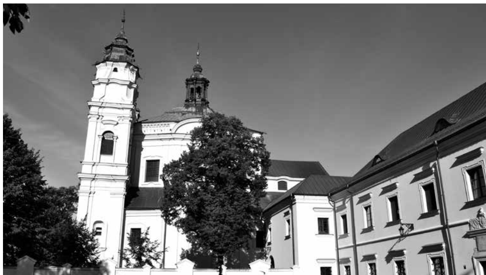
Il. 1. Włodawa, klasztor Paulinów (1706–1724), kościół św. Ludwika Króla (1719/1722–1739/1741–1752–1785) i plac po niezachowanej kaplicy przyklasztornej (przed 1711– przed 1717; rozbiórka po 1795/ po 1818), fot. M. Ludera.