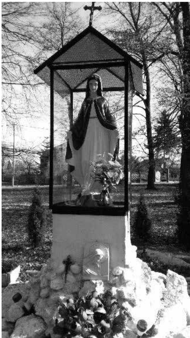
Fot. 3. Kapliczka Matki Bożej w Żabikowie przy której mieszkańcy w tajemnicy przed Niemcami spotykali się na nabożeństwa majowe.