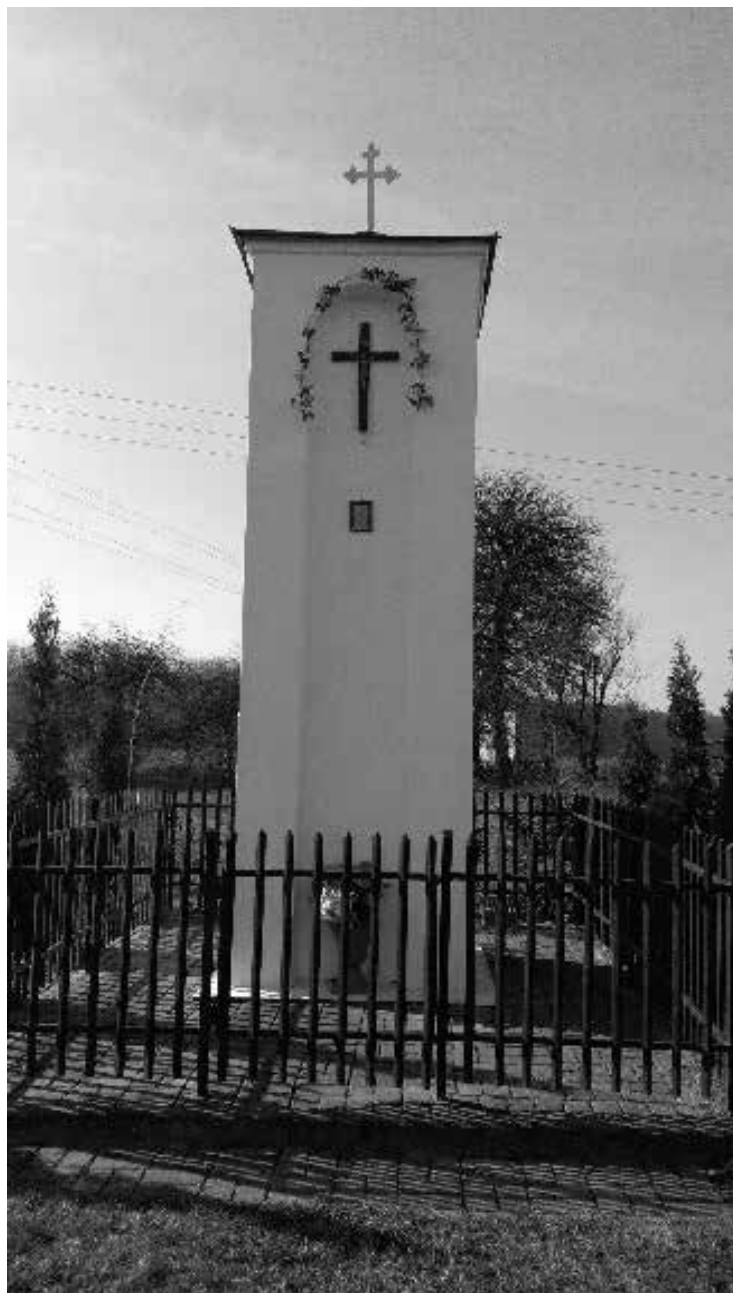
Fot. 4. Słupowa figura Św. Jana w Żabikowie, przy której w czasie okupacji okupant pozwilił modlić się tylko podczas poświęcenia pól.