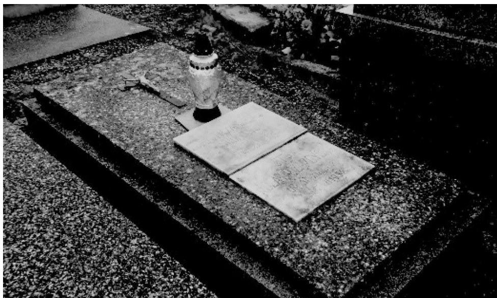
Fot. 6. Nagrobek Róży z Zamoyskich Zamoyskiej i jej córki Zofii z Zamoyskich Sobańskiej na cmentarzu w Rudawie.

Róża Zamoyska zmarła w 1952 roku przeżywszy 89 lat. Pochowana została w skromnym grobie na cmentarzu w Rudawie pod Krakowem. Pamięć o hrabinie Róży, osobie ogromnie wrażliwej na problemy społeczne, zaangażowanej w rozwój oświaty ludowej i dobrodziejce kościoła parafialnego, pozostała do dziś żywa wśród mieszkańców Różanki i w tradycji lokalnej 48 .