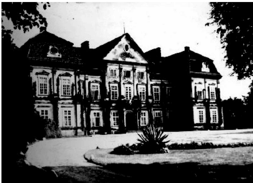
Fot. 4. Pałac w Różance przed 1915 r.

Za Róży i Augusta Adama Zamoyskich Różanka i dobra włodawskie przeżywały czasy największej świetności. W krajobrazie majątku ciągle pojawiały się nowe zabudowania, zalesiano ogromne obszary, likwidowano nieużytki, rolnictwo przynosiło lepsze plony, z sukcesem rozwijała się też hodowla koni i bydła. Stary pałac został gruntownie wyremontowany, przez co zwiększyła się jego reprezentacyjność. Stosunki dworu i wsi układały się dobrze. Wymownym symbolem tego zgodnego współżycia stała się budowa wspólnymi siłami świątyni katolickiej. Wszystko to stanowiło powód do dumy, zarówno dla Zamoyskich, jak i dla mieszkańców Różanki. Róża Zamoyska cieszyła się mianem „opiekunki wiejskiej dziatwy”. Znała była jej dobroczynność, często wspierała potrzebujących i udzielała się w przedsięwzięciach charytatywnych.